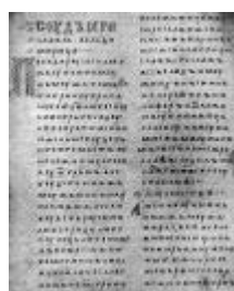
Двинская уставная грамота

Лихоимец – жадный вымогатель, взяточник».