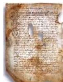
Псковская судная грамота

Двинская уставная грамота 1397 года. Мздоимство упоминается в русских летописях XIV века, например в Двинской уставной грамоте 1397 года в статье 6: «А самосуда четыре рубли, а самосуд то: кто изыснав татя с поличным, да отпустит, а себе посул возьмет, а наместники доведаются по заповеди, ино то самосуд, а опричь того самосуда нет». Там же, в статье 8: «...а черес поруку не ковати, а посула в железех не просити; а что в железех посул, то не в посул».