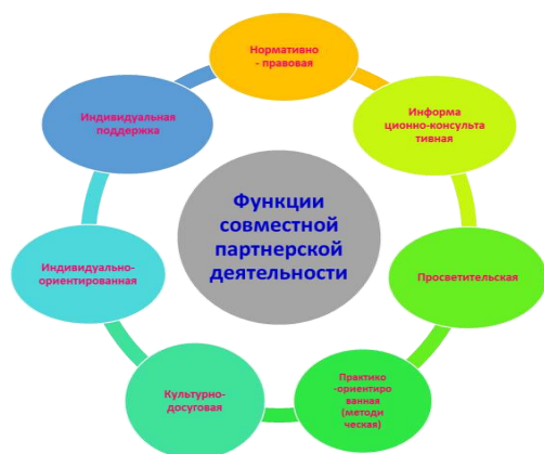
Рисунок 1. Модель включенности родителей в образовательный процесс МБДОУ - детский сад № 393.

Проектирование деятельности по обеспечению включенности родителей в образовательный процесс осуществляется на основе следующей модели (рисунок 1):