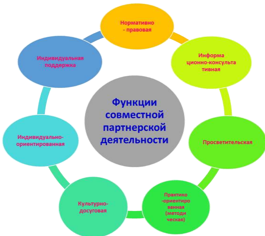
Рисунок 1. Модель включенности родителей в образовательный процесс МБДОУ - детский сад № 393.

Проектирование деятельности по обеспечению включенности родителей в образовательный процесс осуществляется на основе следующей модели (рисунок 1):