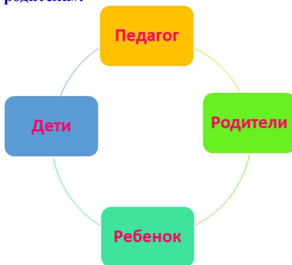
Рисунок 3. Система взаимодействия участников воспитательного процесса.

Формат совместной деятельности в формах взаимодействия «Педагог – дети» и «Родители – ребенок» представлен в рисунке 3.